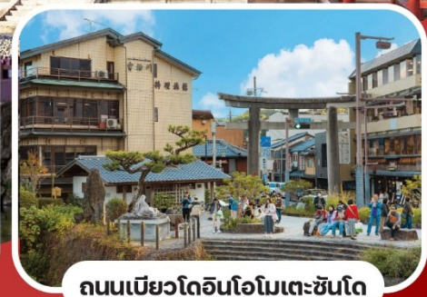
ถนนเมียวโดอินโอมิเตะ-ชินโด

หมู่บ้านชิราคาวาโกะ | เมืองเก่าทาคายาม่า | ขึ้นกระเช้าลอยฟ้าโกไซโซ ปราสาทโอซาก้า | วัดเมียวโดอิน | ถนนเมียวโดอินโอมิเตะ-ชินโด ช้อปปิ้งย่านชินไซบาชิ และ Rinku Premium Outlets