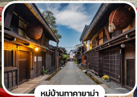
หมู่บ้านทาคายาม่า