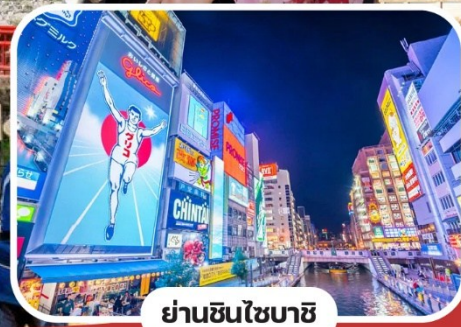
ย่านชินไซบาชิ