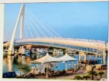
สะพานคู่รักตั้นสุ่ย