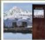
ป่าทางเฉิงตู