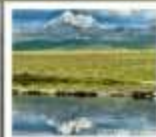
ดวงตาแห่งต่าง