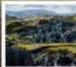
สวนหินป่าหมื่น