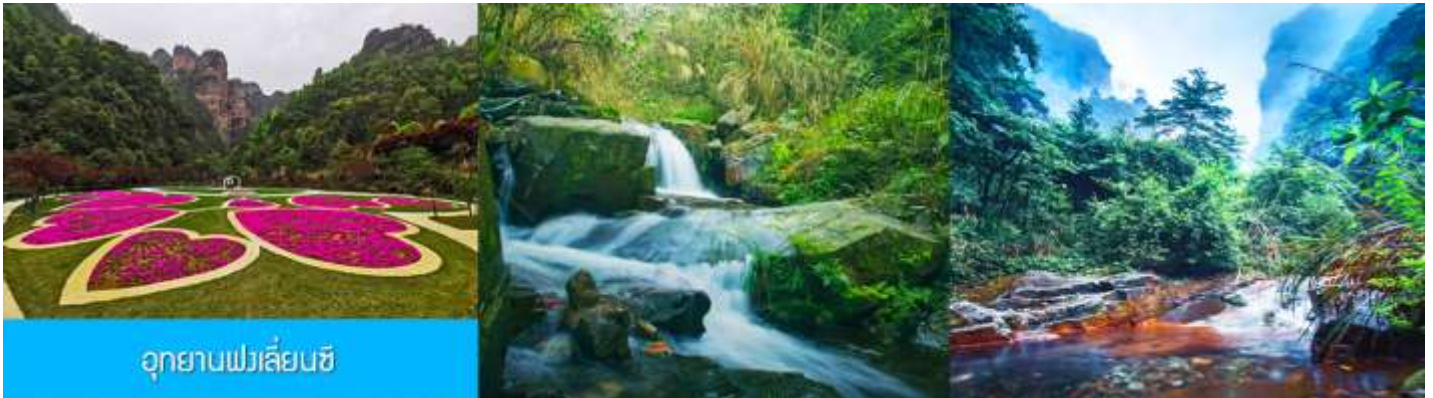
อุทยานฟงเลียนซี