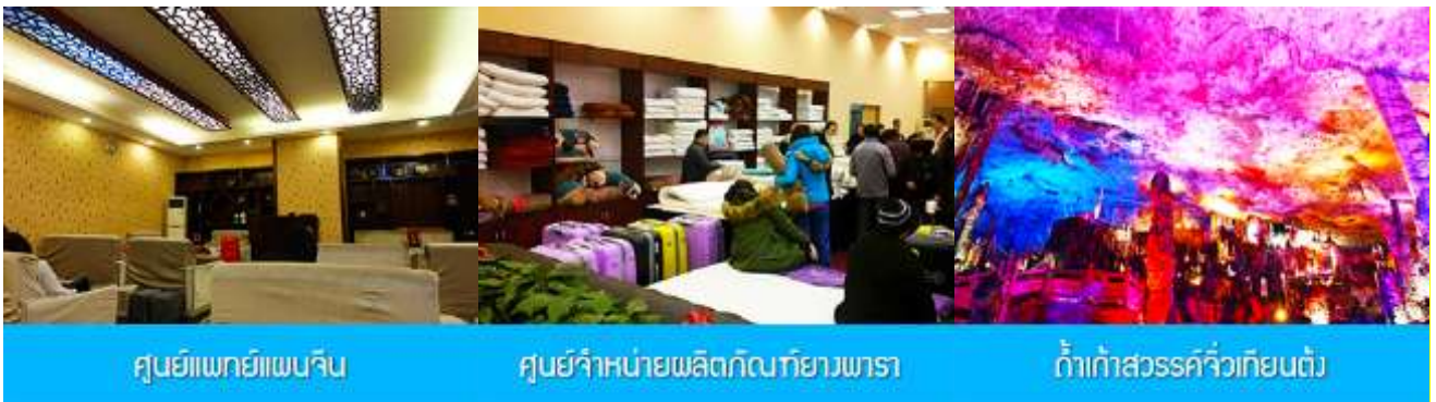
ศูนย์แพทย์แผนจีน

อัตราค่าบริการสำหรับโปรแกรมเสริมการแสดงชุด The love Story of Wooden man and Fairy Fox ท่านละ 400 หยวน (หรือประมาณ 2000.-บาทขึ้นอยู่กับอัตราแลกเปลี่ยน) ระยะเวลาที่ใช้ในการเที่ยวชมการแสดง ประมาณ 3 ชั่วโมง รวมเวลาเดินทางไป กลับค่าบริการรวม ค่าบัตรเข้าชม ค่ารถรับ ส่ง และค่าน้ำดื่มของไกด์ท้องถิ่น