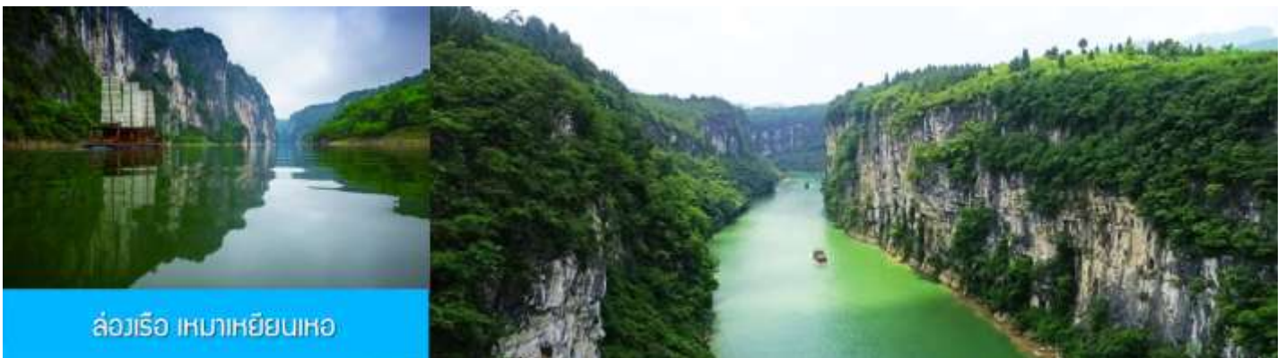
ล่องเรือ เหมาเหยียนเหอ