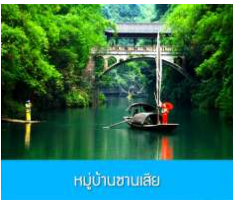
หมู่บ้านซานเสี