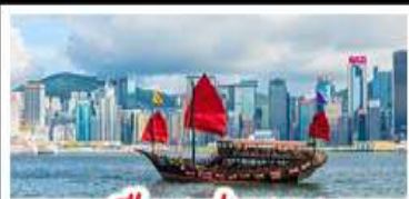
เมืองฮ่องกง

เมืองเก่าชิงเต่า - วิวเมืองอ่องกง โรงเบียร์ชิงเต่า - ท่าเรือชาวประมงเยียนโก