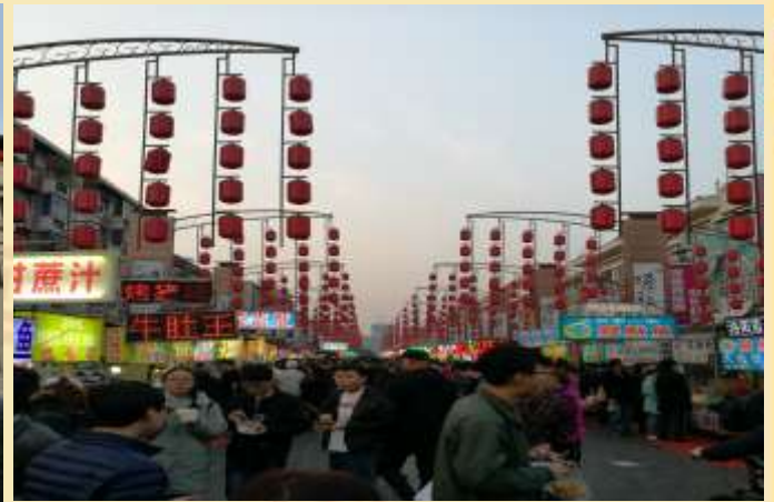
ค่ำ 📍 บริการอาหารค่ำ ณ ภัตตาคาร ที่พัก REZEN HOTEL ระดับ 4 ดาว หรือเทียบเท่า