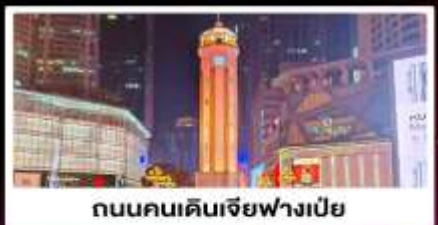
ถนนคนเดินเจียฟางเป่ย์