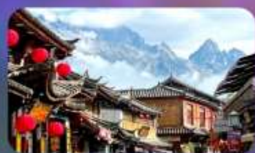
เมืองโบราณซาซี