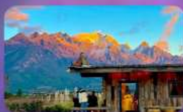
คาเฟ่ Yun Ti Yang