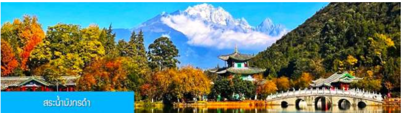
สะพานน้ำมังกรดำ