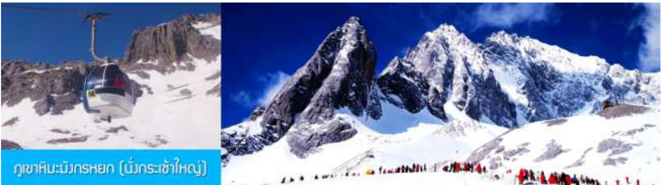
ภูเขาหิมะมังกรหยก (เขื่อนกระซำใหญ่)

พักที่ FENGHUNG YANGSHENG HOTEL ระดับ 4 ดาวที่องถิ่นหรือเทียบเท่าใน เมืองลี่เจียง