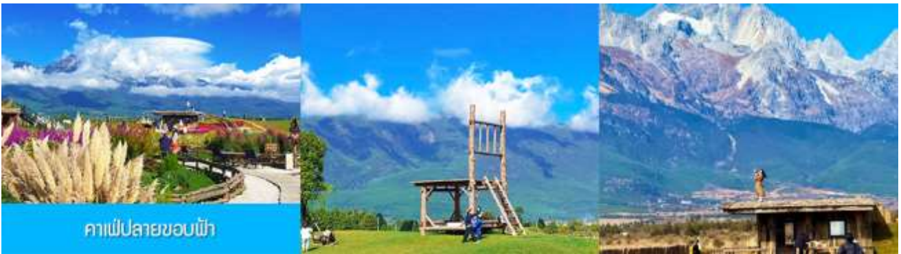
คาเฟ่ปลายขอบฟ้า

เที่ยง รับประทานอาหารกลางวัน ณ ภัตตาคาร (2)