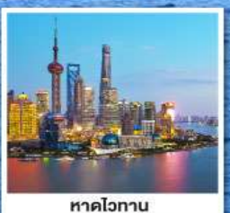
หาดไวทาน