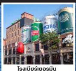
โรงแรมริเวอร์ฮิลล์