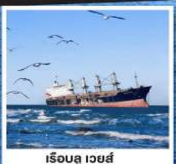
เรือบลูเวย์ส