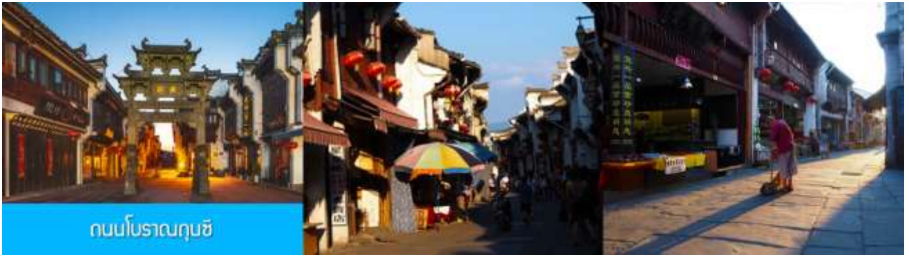
ถนนโบราณถุนซี

นำท่านเที่ยวชม ถนนโบราณถุนซี 屯溪老街 ถนนที่เป็นย่านการค้าโบราณในยุคราชวงศ์ซ่งซึ่งได้อายุกว่า 700 ปี ถนนมีความยาวราว 1272 เมตร สองฝั่งถนนมีอาคารบ้านเรือนโบราณสไตล์หุยโจวที่สร้างในยุคปลายราชวงศ์หมิงและราชวงศ์ชิงที่ถูกอนุรักษ์ไว้เป็นอย่างดี ปัจจุบันยังมีห้างร้าน โบราณ อาทิ ร้านขายโบราณวัตถุ ร้านขายหยก ร้านขายภาพเขียนและอักษรพู่กันโบราณ ร้านอาหารพื้นเมือง ร้านขายของที่ระลึก ฯลฯ นอกจากนี้ร้านค้าและอาคารบ้านเรือน โบราณที่นี่ยังเป็นแหล่งรวมของนักท่องเที่ยวที่มาชิมอาหารพื้นเมือง เดินช้อปปิ้งและถ่ายภาพ เซ็คอิน