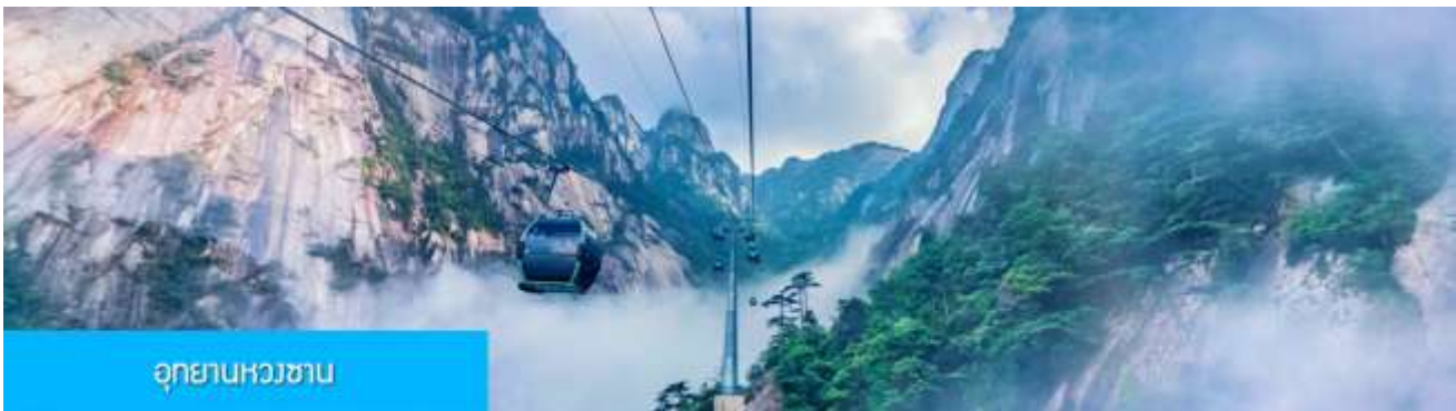
อุทยานหวงซาน