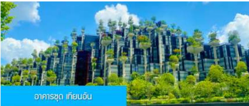
อาคารชุด เทียนอัน