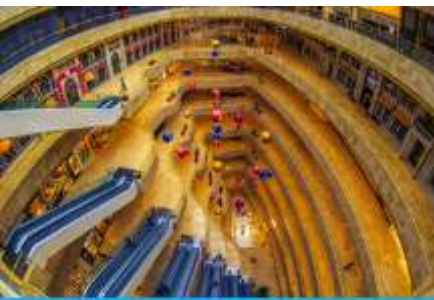
จัตุรัสเต๋อจี

พักที่ โรงแรม Holiday Inn Express Dongshan Hotel 4* หรือเทียบเท่าในนครหนานจิง