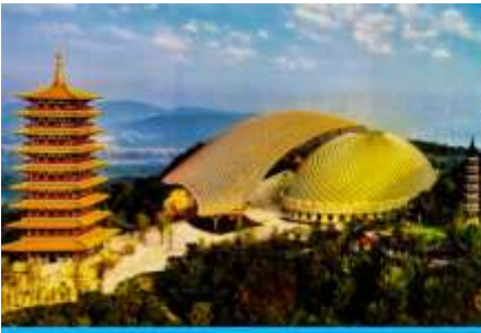
อุทยานหนิวโล่วซาน