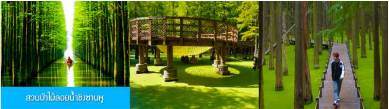
สวนป่าไม้ลอยน้ำชิงชานหู

พักที่ โรงแรม Holiday Inn Express Hotel 4* หรือเทียบเท่าในนครเซี่ยงไฮ้