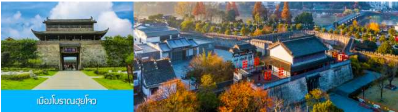
เมืองโบราณซูโจว

เที่ยง รับประทานอาหารกลางวัน ณ ภัตตาคาร (9) หลังอาหารเช้าท่านเที่ยวชม สวนป่าไม้ลอยน้ำชิงชานหู 青山湖水上森林公园 ตั้งอยู่ในตำบลหลิงอัน มณฑลเจ้อเจียง ครอบคลุมพื้นที่ 64 ตารางกิโลเมตร ประกอบด้วยทะเลสาบชิงชานหู ภูเขาชิงจิงชาน หลังหลงชาน จิวเซียนชาน และเป่าถ่าชาน นอกจากนี้ที่เป็นอุทยานธรรมชาติที่มีผืนป่าอุดมสมบูรณ์ ที่นี้ยังเป็นผืนป่าลอยน้ำที่ขึ้นชื่อ.....นำท่านเดินเลาะไปตามระเบียบชมวิวท่ามกลางผืนป่าท่ามกลางอากาศที่บริสุทธิ์ พบกับต้นไม้ที่ขึ้นอยู่เหนือผิวน้ำที่ปกคลุมด้วย หญ่จอกแหวน 浮萍 อันเป็นปรากฏการณ์ทางธรรมชาติที่น่าอัศจรรย์..... จากนั้นนำท่านเดินทางโดยรถบัสสู่ เมือง โบราณซูโจว (ระยะทาง 149 กม. ใช้เวลาเดินทางราว 2 ชั่วโมงเศษ)