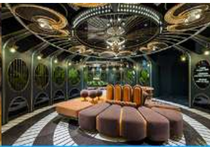
ห้องน้ำไอเทค