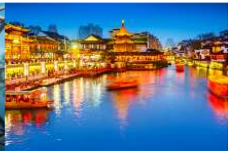
ย่านฟูจื่อเมี่ยว