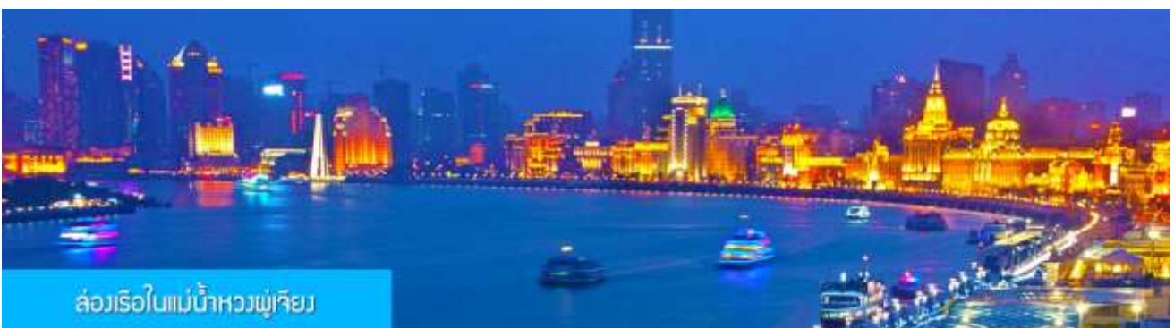
ล่องเรือในแม่น้ำหวงพูเจียว