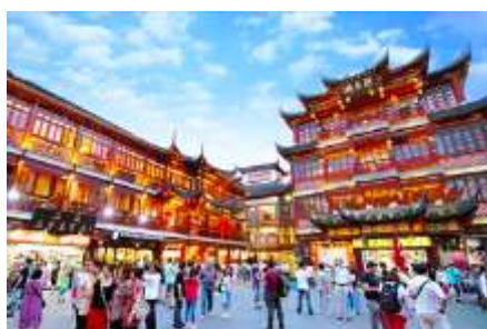
ตลาดร้อยปีเวินหวงเมี่ยว

พักที่ โรงแรม Holiday Inn Express Hotel 4* หรือเทียบเท่าในนครเซี่ยงไฮ้