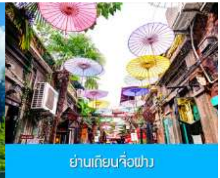
ย่านเทียนจื่อฟาง