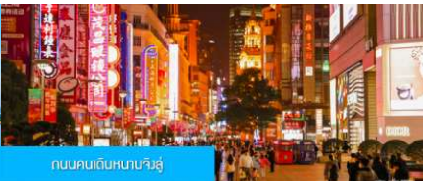
ถนนคนเดินหนานจิงอู๋

จากนั้นนำท่านเดินทางสู่ ย่านช้อปปิ้งที่ใหญ่และคึกคักที่สุดของมหานครเซี่ยงไฮ้ ถนนคนเดินหนานจิงอู๋ 南京路步行街 ให้ท่านเพลิดเพลินกับการเดินเที่ยว ชม และ ช้อปปิ้ง ชิมอาหารหรือของทานเล่นอย่างจุใจ ในย่านถนนคนเดินนี้ นอกจากร้านค้าสินค้าแบรนด์เนมจากต่างประเทศแล้ว สินค้าแฟชั่น และสินค้าแบรนด์จีนก็มีให้เลือกอย่างมากมาย ร้านอาหารและเครื่องดื่มก็มีให้เลือกนั่งเลือกชิมมากมาย.. หรือ ตามล่าหา ลาบูมู ที่ร้าน POP MART ที่ใหญ่ที่สุดในเมืองเซี่ยงไฮ้