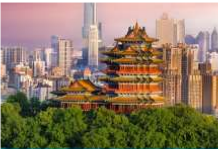
นครนานกิง