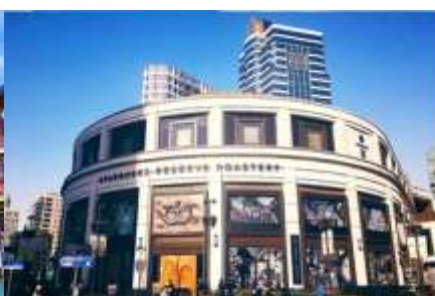
Starbuck Reserve Roastery