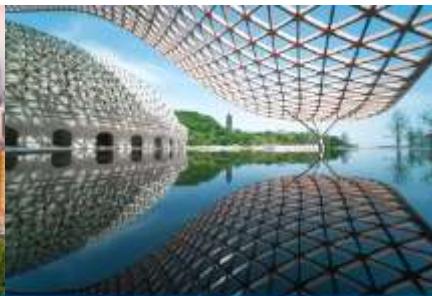
อุทยานก่อกว่กั๋วเหวินโถ้วซาน