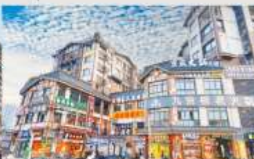
หมู่บ้านโบราณฉือซีโซ่ว

*ทางบริษัทฯ ขอสงวนสิทธิ์ในการสลับโปรแกรมทัวร์ตามความเหมาะสมขึ้นอยู่กับสถานการณ์หน้างาน โดยคำนึงถึงผลประโยชน์ของลูกค้าเป็นสำคัญ