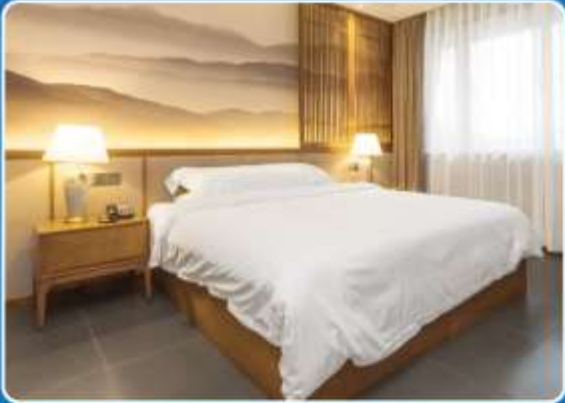
👤 SINGLE (SGL)