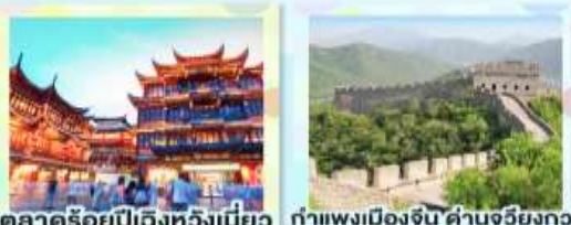
ตลาดร้อยปีเฉิงหวงเหมียว กำแพงเมืองจีน ด้านจวิชัยกวน