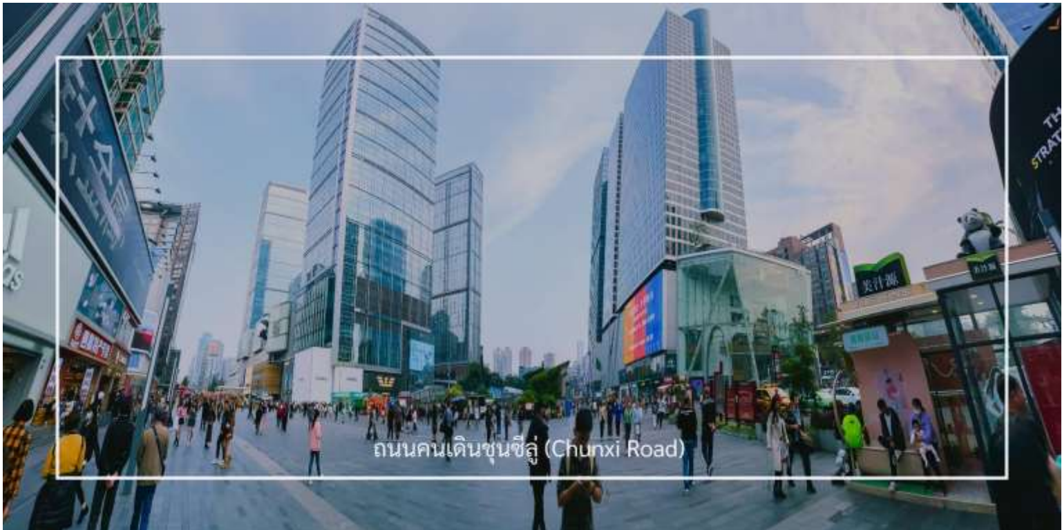
ถนนคนเดินชุนซีลู่ (Chunxi Road)

เดินข้ามถนนมาอีกหน่อย ท่านจะได้ซื้อป๊อปปี้ ถนนคนเดินชุนซีลู่ (Chunxi Road) เต็มไปด้วยร้านค้าแบรนด์ชั้นนำทั้งในและต่างประเทศ รวมถึงร้านเสื้อผ้าแฟชั่น รองเท้า อุปกรณ์อิเล็กทรอนิกส์ และของฝาก ถนนคนเดินชุนซีลู่เป็นจุดที่มีความคึกคักและเต็มไปด้วยผู้คน โดยเฉพาะในช่วงวันหยุดสุดสัปดาห์และเทศกาลต่างๆ คุณจะได้พบกับการแสดงศิลปะ การแสดงดนตรี และกิจกรรมที่น่าสนใจ มีร้านอาหารมากมายที่เสิร์ฟอาหารท้องถิ่นและขนมหวานที่หลากหลาย นักท่องเที่ยวสามารถลิ้มลองเมนูพื้นเมืองที่อร่อย เช่น เสี่ยวหลงเปา (ซาลาเปานึ่ง) หรือขนมโบราณตามรอยซีรีส์จีนอย่าง มาไลโกว ก็มีเช่นกัน