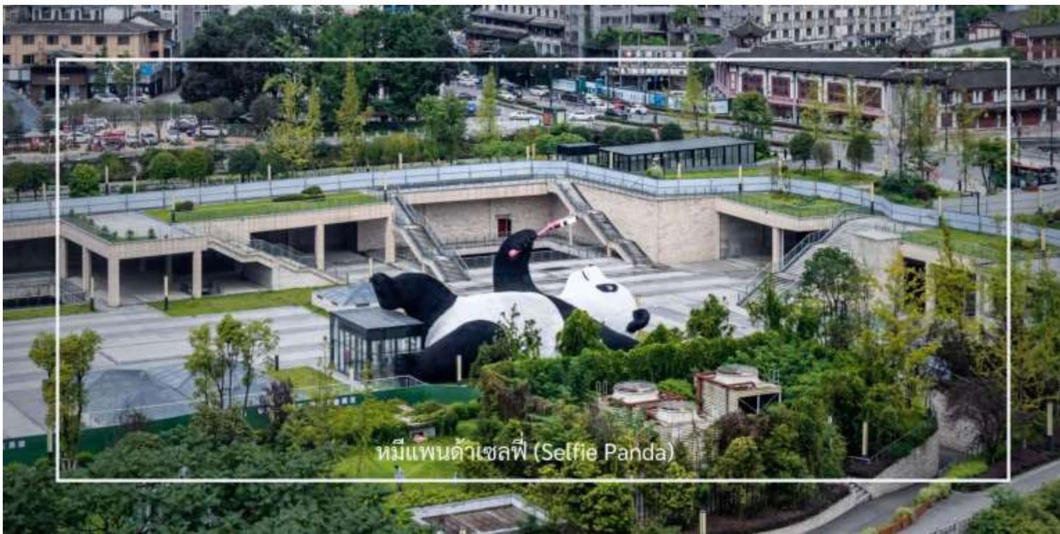
หมีแพนด้าเซลฟี่ (Selfie Panda)

เที่ยวชม ถนนคนเดินความจำย (ชอยกว้าง-แคบ) (Kuanxiangzi Alley) ถนนโบราณหรือในชื่อภาษาไทยจะถูกแปลออกมาว่า "ถนนชอยกว้างชอยแคบ" โดยมีนัยว่า หากถนนมีความกว้างนั้นหมายถึงพื้นที่สำหรับคนชนชั้นสูง หรือคนมีฐานะ เพราะคนสมัยนั้นโดยสารกันด้วยรถม้านั่นเอง แต่หากเป็นชอยแคบๆ ก็จะเป็นที่พักอาศัยของคนที่มีฐานะปานกลาง ก่อนจะมีการบูรณะให้กลายเป็นแหล่งท่องเที่ยว ถนนคนเดินความจำยเป็นสถานที่ที่มีความคึกคักและมีชีวิตชีวา โดยเฉพาะในช่วงเย็น ที่ผู้คนมักออกมาเดินเล่นและสนุกกับกิจกรรมต่างๆ ถนนนี้เต็มไปด้วยร้านค้า ร้านอาหาร และร้านขายของที่ระลึก นักท่องเที่ยวสามารถเลือกซื้อสินค้าท้องถิ่น เช่น งานหัตถกรรม เสื้อผ้า และของฝากต่างๆ รวมถึงอาหารท้องถิ่นที่อร่อย