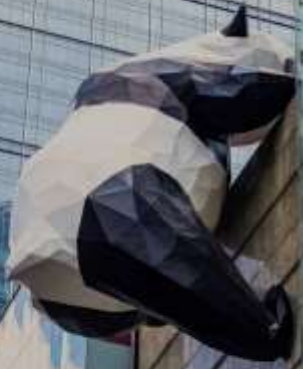
ย่านไท่กุ่หลี่ IFS (หมีแพนด้าป็นตึก)

เดินข้ามถนนมาอีกหน่อย ท่านจะได้ซื้อป๊อปปี้ ถนนคนเดินชุนซีลู่ (Chunxi Road) เต็มไปด้วยร้านค้าแบรนด์ชั้นนำทั้งในและต่างประเทศ รวมถึงร้านเสื้อผ้าแฟชั่น รองเท้า อุปกรณ์อิเล็กทรอนิกส์ และของฝาก ถนนคนเดินชุนซีลู่เป็นจุดที่มีความคึกคักและเต็มไปด้วยผู้คน โดยเฉพาะในช่วงวันหยุดสุดสัปดาห์และเทศกาลต่างๆ คุณจะได้พบกับการแสดงศิลปะ การแสดงดนตรี และกิจกรรมที่น่าสนใจ มีร้านอาหารมากมายที่เสิร์ฟอาหารท้องถิ่นและขนมหวานที่หลากหลาย นักท่องเที่ยวสามารถลิ้มลองเมนูพื้นเมืองที่อร่อย เช่น เสี่ยวหลงเปา (ซาลาเปานึ่ง) หรือขนมโบราณตามรอยซีรีส์จีนอย่าง มาไลโกว ก็มีเช่นกัน