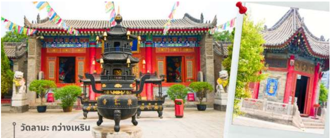
วัดลามะ กว่างเหริน