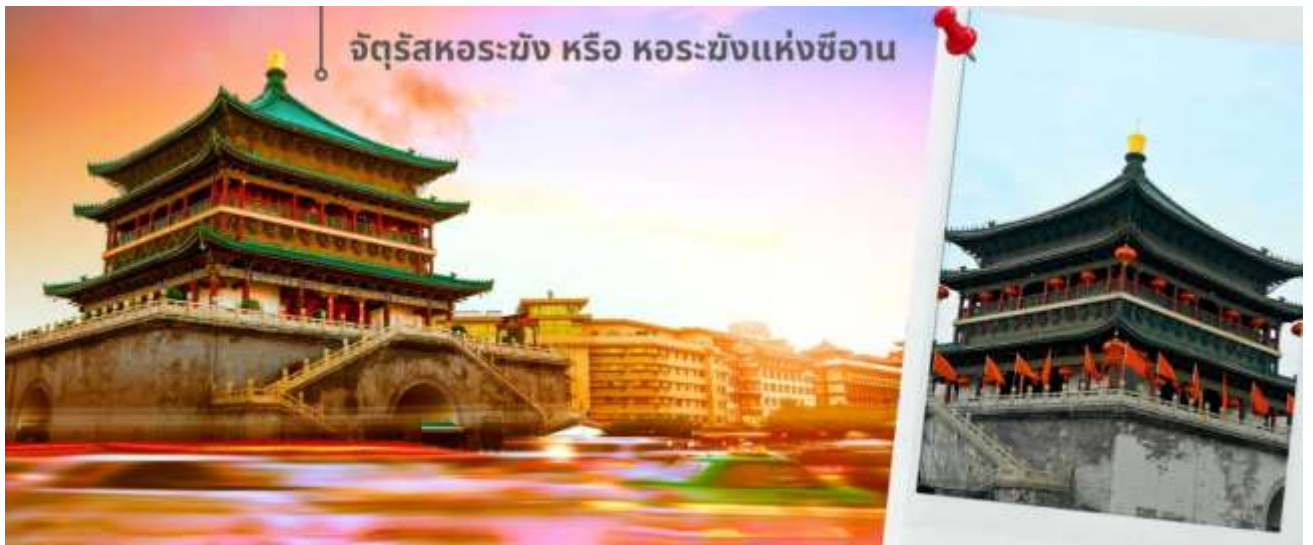
จัตุรัสหอร่ซัง หรือ หอร่ซังแห่งซีอาน

จากนั้นนำท่านเดินทางเที่ยวชม จัตุรัสหอร่ซัง หรือ หอร่ซังแห่งซีอาน เป็นหนึ่งในสัญลักษณ์สำคัญของเมืองซีอาน ตั้งอยู่ใจกลางเมือง สร้างขึ้นในปี ค.ศ. 1384 สมัยราชวงศ์หมิง เพื่อใช้ประกาศเวลาและเตือนภัยจากศัตรู ตัวหอสร้างจากไม้ทั้งหลัง มีความสูงประมาณ 36 เมตร โดดเด่นด้วยสถาปัตยกรรมจีนโบราณที่งดงาม และการประดับด้วยลวดลายสีทองและเขียว จัตุรัสแห่งนี้เป็นจุดตัดของถนนสายหลักทั้งสี่สาย สามารถขึ้นไปชมวิวเมืองซีอานแบบพาโนรามาได้ด้านบน นอกจากนี้ ภายในยังมีนิทรรศการเกี่ยวกับประวัติศาสตร์และวัฒนธรรมของหอร่ซังให้ได้ชมอีกด้วย