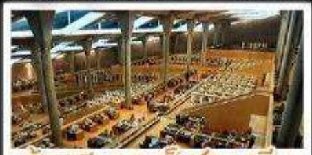
ห้องสมุดอเล็กซานเดรีย