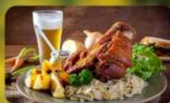
พิเศษ! ลิ้มลองเมนูประจำชาติ ทั้ง 5 ประเทศ!!!