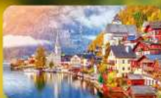
การันตีที่พัก Hallstatt / St. Wolfgang หรือริบทะเลสาบ 1 คืน