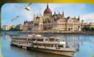
ล่องเรือแม่น้ำดานูบ พร้อมจิบแชมเปญ