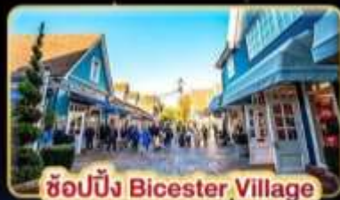
ช้อปปิ้ง Bicester Village