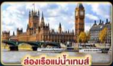
ล่องเรือแม่น้ำเทมส์