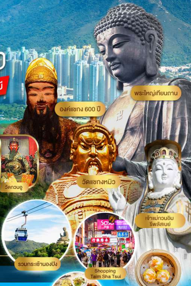
พระใหญ่เทียนถาน