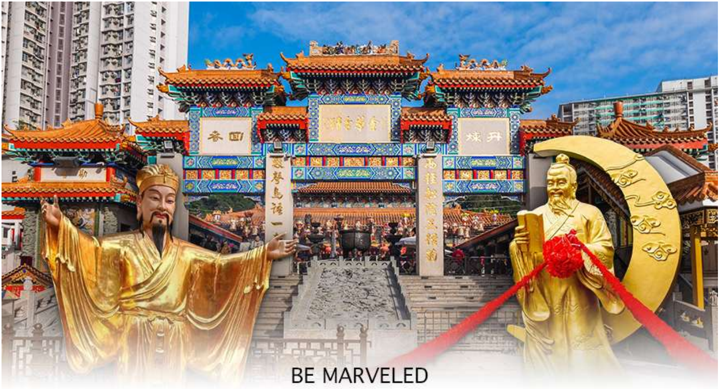
BE MARVELED วัดหวังต้าเซียน