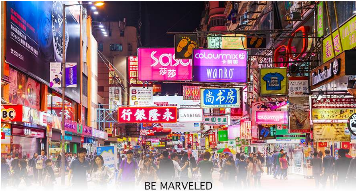
BE MARVELED TSIM SHA TSUI

📍 อีตระอาหารอาหารเข็นตามอรัยาศัย **เพื่อความสะดวกในการช้อปปิ้ง**