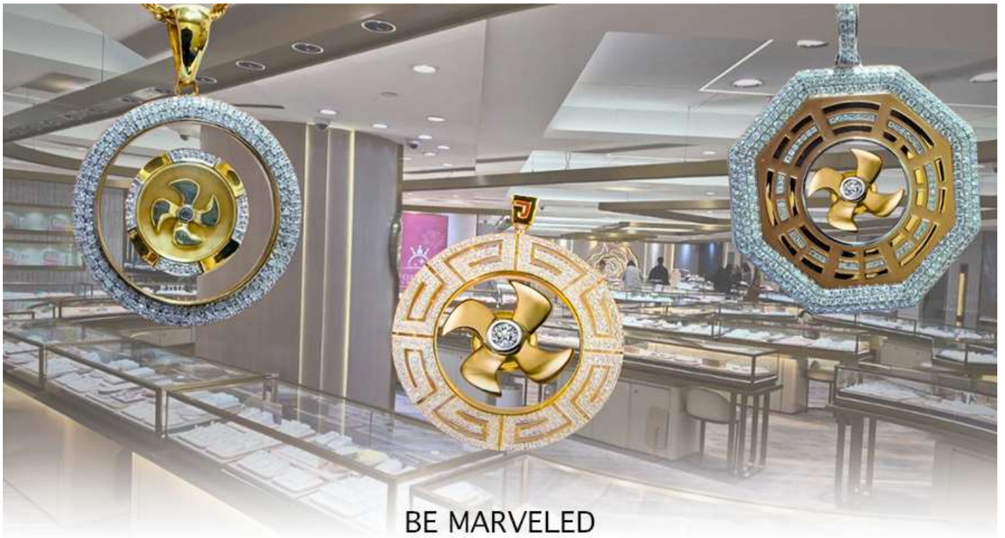
BE MARVELED ศูนย์ฮวงจุ้ย กังหันเศรษฐี

และนำท่าน ชม ศูนย์ฮวงจุ้ย ซึ่งคนจีนนั้น ถือว่าหยกเป็นหิน ที่เป็นตัวแทนของความสวยงามและความบริสุทธิ์มีความเชื่อว่า หยก มงคล ถ้าพกติดตัวไว้จะอายุยืนและสุขภาพดีมีสินค้านี้มากมายเกี่ยวกับหยก อาทิ กำไลหยก หรือสัตว์นำโชคอย่างปี่เซ่เย่ ให้ ท่าน ได้เลือกซื้อเป็นของฝาก, ของที่ระลึก หรือของนำโชคแต่ตัวท่านเอง