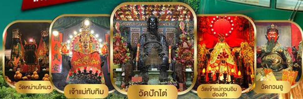
วัดหนานโหมว