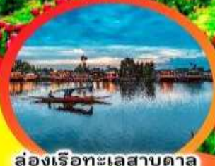
ล่องเรือทะเลสาบดาล