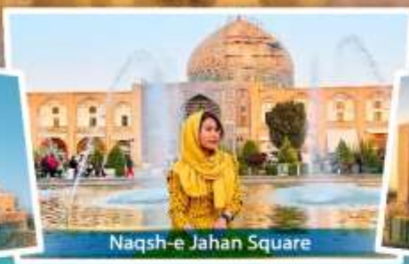
Naqsh-e Jahan Square