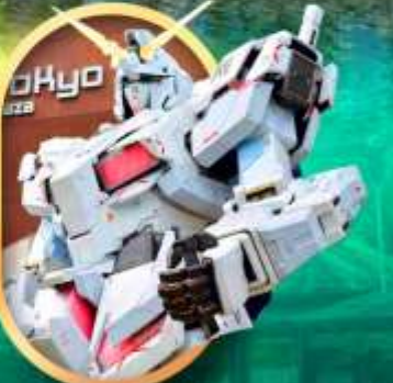
ห้างโอโดบะกินคิม