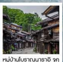
หมู่บ้านโบราณนารายิ จุกุ