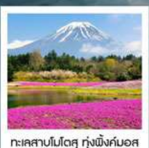
ทะเลสาบโมโตสุ ทุ่งพืชมอส