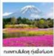
ทะเลสาบโมโตสุ ทุ่งพืชมอส