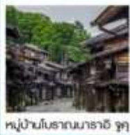
หมู่บ้านโบราณนาราอิ จุกุ