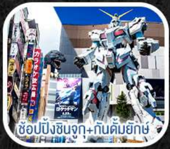
ช้อปปิ้งชินจูกุ+กันดั้มยักษ์