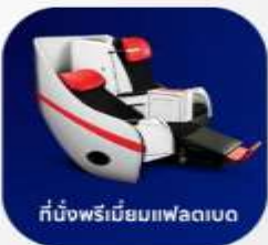
ที่นั่งพรีเมียมฟเลกซ์