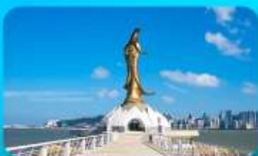
เจ้าแม่กวนอิมริมทะเล

NANYANG SEASCAPE HOTEL หรือเทียบเท่า 4 คาว