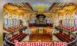
โรงละครปลาลาเตลา บูลีก้า คาตาลาซา