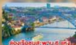
ล่องเรือชมสะพาน 6 แห่ง ในคูร์เมืองปอร์โต