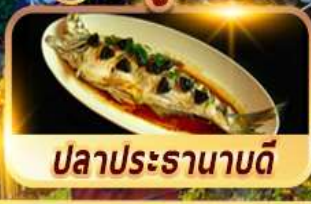
ปลาประรานาบดี