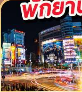
ย่านซีเหมินติง