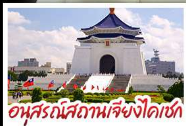
อนุสรณ์สถานเจียงไคเชก