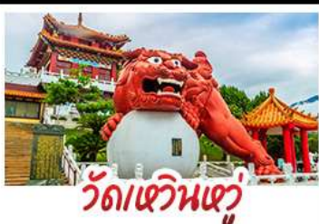
วัดเขวินเซวู

อาลีซาน - ทะเลสาบสุริยอันจินตรา -ไทเป101 วัดหวินหู้ - อนุสรณ์สถานเจียง ไคเชก วัดหลงซาน - ตลาดกลางคืนซีเหมินติง เมมู หมอหนึ่งจักรพรรดิ - เขียวหลงเป่า - ชาบูไต้หวัน