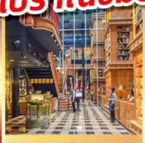
ร้านไอศกรีมมียาฮาร่า