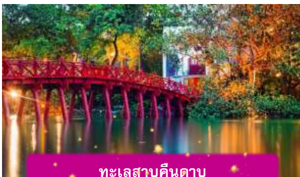
ทะเลสาบคินดาบ