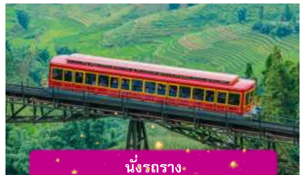
นั่งรถราง

เที่ยง บริการอาหารกลางวัน ณ ภัตตาคาร พิเศษ ... เมนูบุฟเฟ่ฟานซีปัน