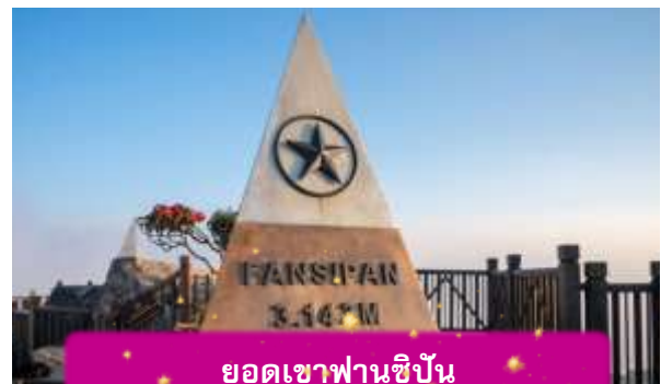
ยอดเขาฟานซีปัน