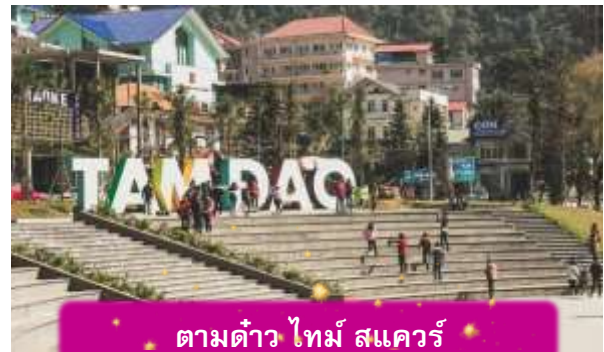
ตามด้าว ไทม์ สแควร์

อิสระท่าน ตลาดกลางคืนตามด้าว เมื่อแสงแดดลับขอบเขา เมืองบนดอยแห่งนี้จะค่อย ๆ เปลี่ยนบรรยากาศเป็นความคึกคักแบบเรียบง่าย ตลาดกลางคืนตามด้าวเต็มไปด้วยของกินพื้นเมือง กลิ่นหอมของหมูย่าง ไชนักระดาก และข้าวโพดย่างลอยคลุ้งไปทั่ว นักท่องเที่ยวเดินจับจ่าย พุดคุย และหยุดถ่ายรูปตามแสงไฟที่ประดับอยู่ทั่วตลาด บรรยากาศเป็นกันเองและอบอุ่น เหมาะกับการเดินเล่น ปิดท้ายวันด้วยความสุขเล็ก ๆ ที่สัมผัสได้