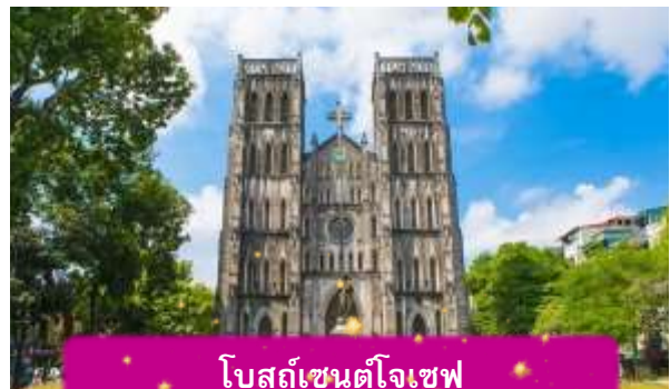
โบสถ์เซนต์โจเซฟ