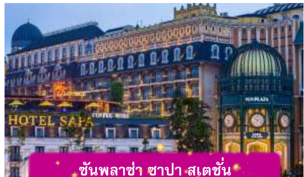
ชั้นพลาซ่า ซาปา สเตชั่น