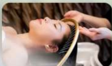
สระผสมสโตร์เวียดนาม