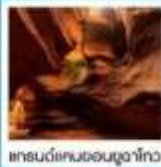
แกรนด์แคนยอนยูลาโกว