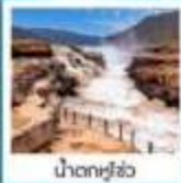
น้ำตกหู่โจว