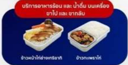
ข้าวพม่าใต้ฟ้าอเมริกา