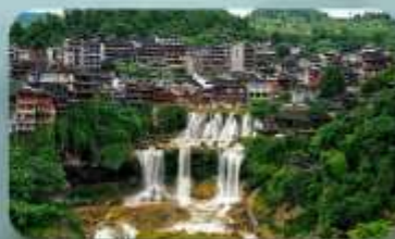
หมู่บ้านฟุทงเจิ้น