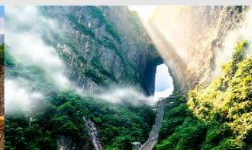
ประตูลัศจรรรมย์