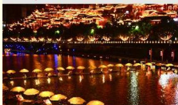
เมืองเซียนเอิน