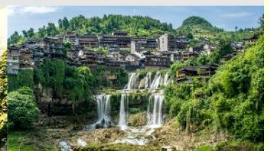
หมู่บ้านโบราณผู่หลงเจิ้น

*ทางบริษัทฯ ขอสงวนสิทธิ์ในการสลับโปรแกรมทัวร์ตามความเหมาะสมขึ้นอยู่กับสถานการณ์หน้างาน โดยคำนึงถึงผลประโยชน์ของลูกค้าเป็นสำคัญ