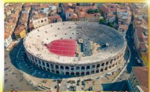
โรงละครโรมันกลางจัหวโรม่า