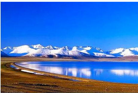
ทะเลสาบชิงไห่ใหญ่