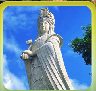
“เจ้าแม่กิมทิมหม่าโจ้ว”