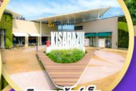
มิตซุยามะ เอ็งากะอิโด พาร์ค คิซะระชู