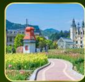
สวน Alice's Garden