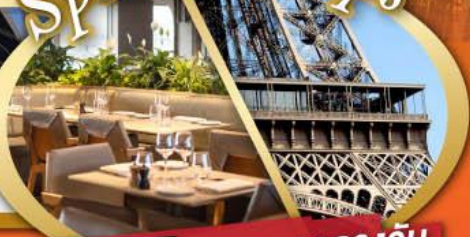
รับประทานอาหารกลางวันบนหอคอยเฟา