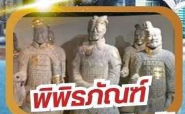
พิพิธภัณฑ์