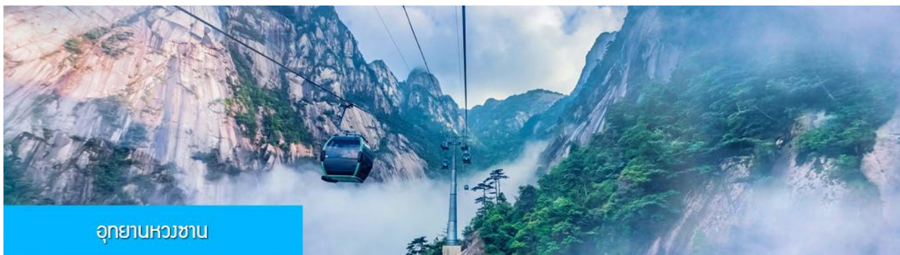
อุทยานหวางซาน