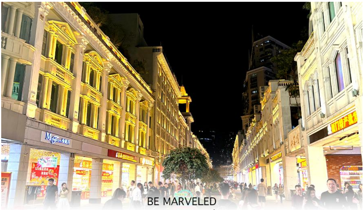
BE MARVELED ถนนคนเดินจงซานหลู่

จากนั้นนำท่านเดินทางไป ถนนคนเดินจงซานหลู่ เป็นถนนการค้าเก่าแก่ที่มีชื่อเสียง เป็นศูนย์กลางแฟชั่นและย่านช้อปปิ้งสำคัญของเมือง นอกจากนี้ ยังมี "สวนจงซาน" (Zhongshan Park) ซึ่งเป็นสวนสาธารณะขนาดใหญ่ใจกลางเมือง