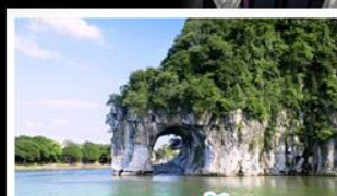
เขางวงช้าง