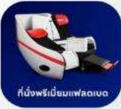
ที่นั่งพรีเมียมแฟลตเบด

บริการอาหารร้อน และ น้ำดื่ม บนเครื่องบิน ขาไป และ ขากลับ