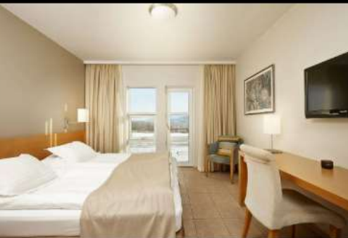
***รูปภาพเพื่อประกอบการโฆษณาเท่านั้น***