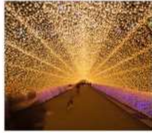
นาบนะโนะซาโตะ