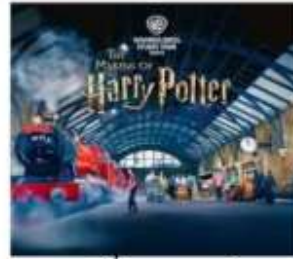
แฮร์รี่ พอตเตอร์ สตูดิโอโตเกียว