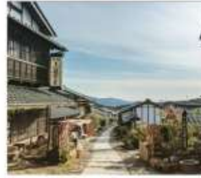
มาโกะเมะจุกุ