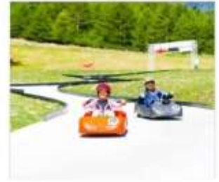
กิจกรรมขับโกคาร์ท