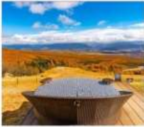
ดิโยซาโตะเทอเรส