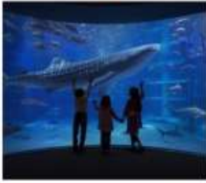
พิพิธภัณฑ์สัตว์น้ำโดยดั่ง